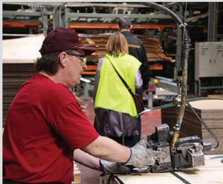
▲ DARBA AIZSARDZĪBAS KONFERENCES DALĪBŅIEKI VIESOJĀS RŪPNĪCĀ "LIGNUMS"