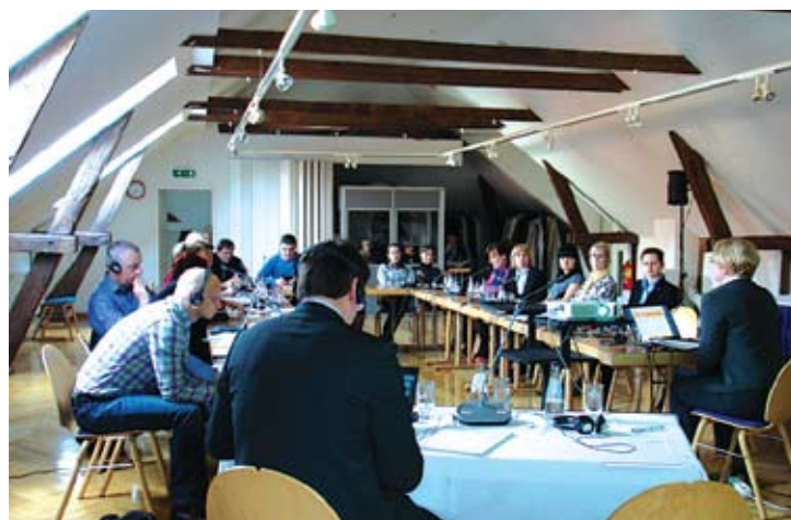
▲ SEMINĀRA DALĪBNIKĀI KLAUSĀS LIA PRIEKŠSĒDĒTĀJAS STĀSTĪTO PAR SOCIĀLO DIALOGU NOZARES UN NACIONĀLĀ LĪMENĪ